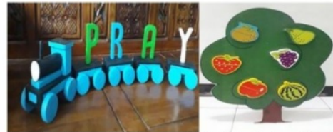
Gambar 2. Hasil Pembuatan APEV Balok dan Puzzle kayu

Dalam pembuatan suatu produk alat permainan edukatif (APE) perancang harus dapat melihat karakteristik teknis desain model APE, karena karakteristik teknis ini mempunyai nilai bobot yang paling tinggi dibandingkan dengan bobot karakteristik yang lain. Oleh karena karakteristik teknis yang paling diutamakan adalah desain sesuai kemauan pelanggan dan alat permainan edukatif (APE) yang mudah dibawa, maka peneliti memerlukan atribut-atribut untuk desain bentuk dan modelnya yang diperlukan untuk perancangan APEV. Dari hasil yang telah didapatkan, dibuatlah rancangan APEV balok dan puzzle kayu seperti dibawah ini.