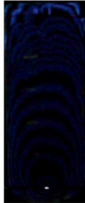
Gambar 4. Pola Rambat Api Campuran Gas Metana-Udara dan N 2 30%