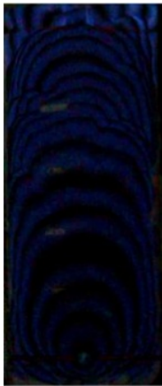
Gambar 6. Pola Rambut Api Campuran Gas Metana-Udara dan N 2 50%

Bentuk rambatan api yang dihasilkan akibat variasi campuran prosentase nitrogen dan gas metana-udara yang dilakukan ternyata menunjukkan perubahan yang berbeda-beda.