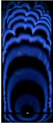
Gambar 5. Pola Rambut Api Campuran Gas Metana-Udara dan N 2 40%