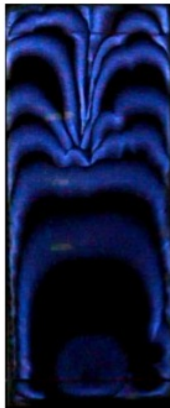
Gambar 2. Pola Rambat Api Campuran Gas Metana-Udara dan N 2 10%

Setelah memproses gambar transparan dengan menggunakan software Adobe Photoshop CS3 maka akan didapatkan gambar bentuk dan pola rambatan api.