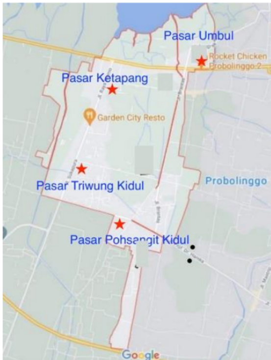
Gambar 2 Lokasi Pelaksanaan Distribusi Hand Sanitizer Daun Sirih