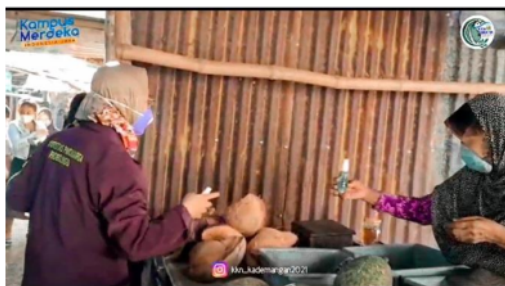
Gambar 2 Hand Sanitizer diterima Pedagang di Pasar Pohsangit Kidul

Keterangan: Pada 15 Agustus 2021, sebanyak 20 botol hand sanitizer dibagikan ke pedagang dan pembeli di pasar. Foto di atas, Dosen Pembimbing Lapangan membantu mahasiswa membagikan hand sanitizer berbahan daun sirih pada salah satu pedagang di pasar. Di saat yang sama, ia menyemprotkan hand sanitizer pada tangan pedagang dan pembeli yang ditemui di pasar pada sosialisasi yang dilakukan pada tanggal