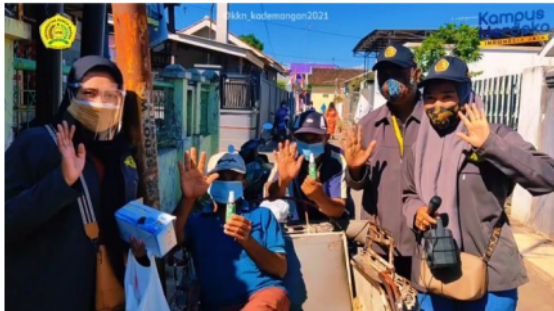
Gambar 5 Hand Sanitizer diterima Pedagang di Pasar Triwung Kidul

Keterangan gambar: Sebanyak 20 botol hand sanitizer dibagikan Cuma Cuma ke pedagang dan pembeli di pasar. Dua Botol disemprotkan pada sebagian pedagang dan pembeli yang ditemui di pasar pada sosialisasi yang dilakukan pada tanggal 16 Agustus 2021.