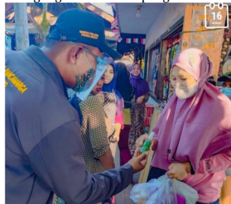
Gambar 4 Hand Sanitizer diterima Pedagang di Pasar Ketapang

Keterangan gambar: Salah satu penjual menerima hand sanitizer dari mahasiswa. Sebanyak 20 botol hand sanitizer dibagikan ke pedagang dan pembeli di pasar.