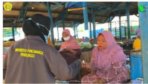
Gambar 3 Hand Sanitizer diterima Pedagang di Pasar Umbul

Keterangan gambar: Salah satu penjual menerima hand sanitizer dari mahasiswa. Sebanyak 20 botol hand sanitizer dibagikan ke pedagang dan pembeli di pasar.