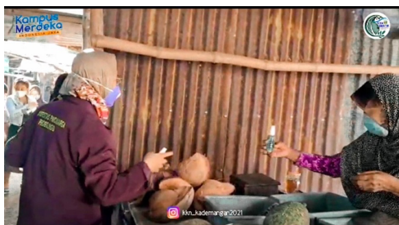
Gambar 2 Hand Sanitizer diterima Pedagang di Pasar Pohsangit Kidul

Keterangan: Pada 15 Agustus 2021, sebanyak 20 botol hand sanitizer dibagikan ke pedagang dan pembeli di pasar. Foto di atas, Dosen Pembimbing Lapangan membantu mahasiswa membagikan hand sanitizer berbahan daun sirih pada salah satu pedagang di pasar. Di saat yang sama, ia menyemprotkan hand sanitizer pada tangan pedagang dan pembeli yang ditemui di pasar pada sosialisasi yang dilakukan pada tanggal