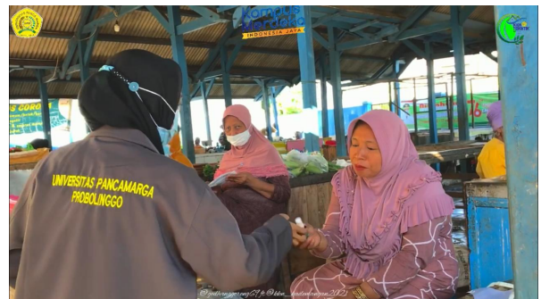
Gambar 3 Hand Sanitizer diterima Pedagang di Pasar Umbul

Keterangan gambar: Salah satu penjual menerima hand sanitizer dari mahasiswa. Sebanyak 20 botol hand sanitizer dibagikan ke pedagang dan pembeli di pasar.