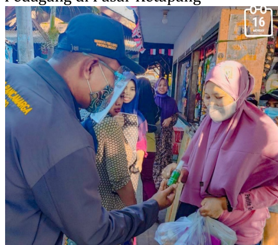
Gambar 4 Hand Sanitizer diterima Pedagang di Pasar Ketapang

Keterangan gambar: Salah satu penjual menerima hand sanitizer dari mahasiswa. Sebanyak 20 botol hand sanitizer dibagikan ke pedagang dan pembeli di pasar.