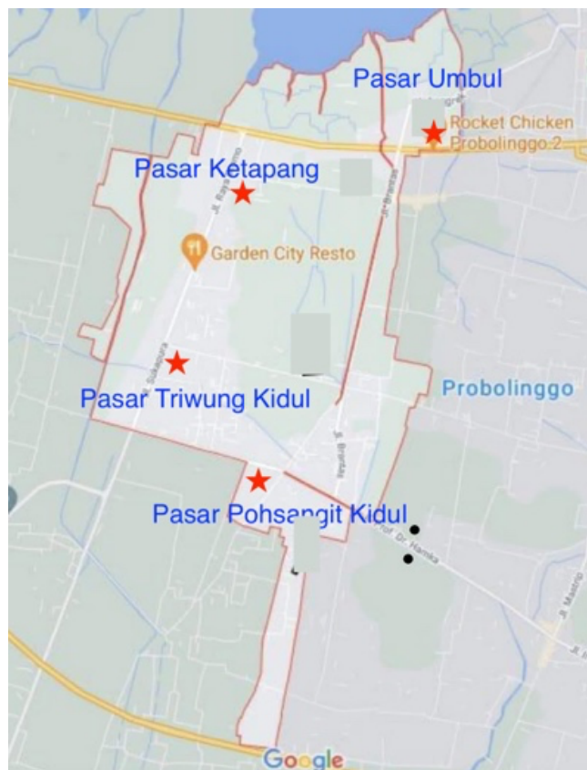
Gambar 2 Lokasi Pelaksanaan Distribusi Hand Sanitizer Daun Sirih