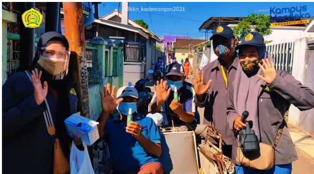
Gambar 5 Hand Sanitizer diterima Pedagang di Pasar Triwung Kidul

Keterangan gambar: Sebanyak 20 botol hand sanitizer dibagikan Cuma Cuma ke pedagang dan pembeli di pasar. Dua Botol disemprotkan pada sebagian pedagang dan pembeli yang ditemui di pasar pada sosialisasi yang dilakukan pada tanggal 16 Agustus 2021.