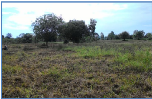
Gambar 1. Kondisi Tanah kering dan Tandus ketika Musim Kemarau

Desa Panaongan terletak disebelah selatan Kecamatan Pasongsongan. Desa Panaongan mempunyai luas 881 km 2 atau 7,40% dari jumlah luas wilayah kecamatan. Mayoritas masyarakat Desa Panaongan adalah petani dan buruh tani. Para petani di Desa Panaongan mengandalkan curah hujan untuk bercocok tanam. Tanah yang kering dan tandus menyebabkan proses cocok tanam hanya sekali dalam setahun. Hampir seluruh tanah hanya bisa ditanami jagung saja ketika musim penghujan. Itupun jagung kecil yang secara komoditas tidak seimbang antara biaya bercocok tanam dengan hasil yang didapat.