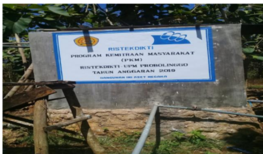
Gambar 4. Pembangunan Tandon