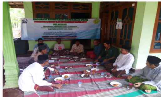
Gambar 5. Pelatihan Pengoperasian dan Perawatan Mesin Celup

Agar pompa mesin Celup dapat digunakan dalam waktu yang lama, perlu diadakan pelatihan pengoperasian dan perawatan mesin Pompa Celup . Pelatihan ini dilakukan kepada anggota Kelompok Tani "Janur Kuning". Jadi, setelah mesin Pompa Celup ini diserahkan ke mitra, anggota dapat melakukan perawatan rutin terhadap Pompa Celup , dan dapat menyelesaikan masalah yang mungkin terjadi selama Pompa Celup ini beroperasi.