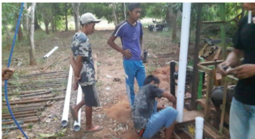
Gambar 3. Pemasangan Pompa Celup

Target setelah pemasangan mesin pompa Celup adalah pompa ini mampu menghasilkan debit luaran air kurang lebih 5m 3 /Hr atau 1,4 liter/detik, sehingga per hari mampu menyalurkan 120.960 liter (1,4 liter x 60 menit x 24 jam). Jika kedua mitra terdiri dari 15 anggota perkelompok, maka dengan pengaturan yang baik dapat diasumsikan bahwa setiap anggota akan mendapatkan 4032 liter air irigasi per hari.