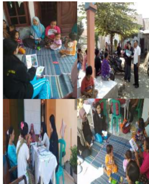
Gambar 3 Kegiatan Edukasi Kesehatan