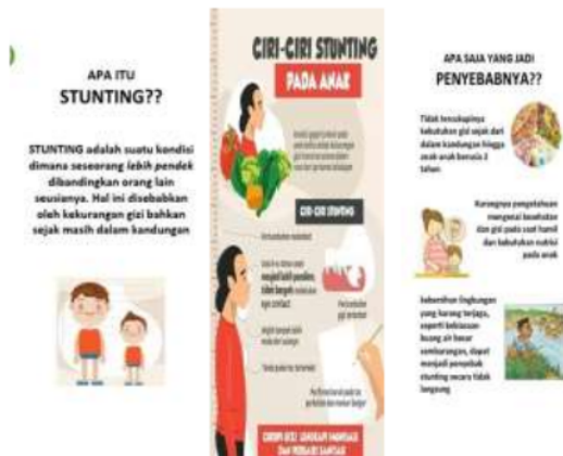
Gambar 2 leaflet stunting