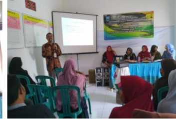
Pemateri Legalitas Usaha