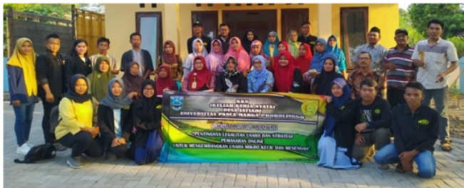
Foto Bersama Peserta, Panitia dan Pemateri