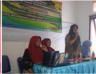
Pemateri Penjualan online