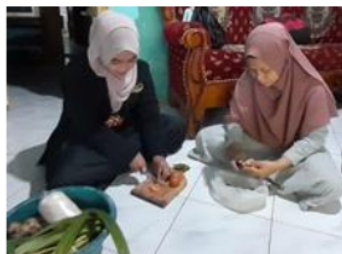
Persiapan Produksi Pokak Jahe