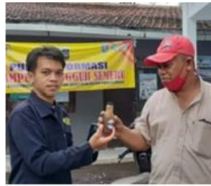
Pembagian Minuman Pokak Jahe