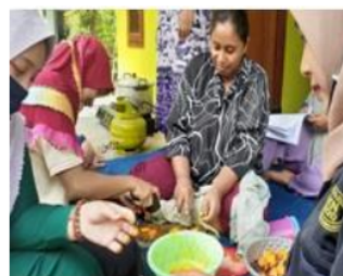
Pembuatan Pokak Jahe