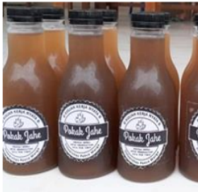
Minuman Pokak Jahe