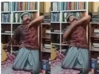
Gambar 4. Adegan tokoh Guru dicekik lehernya oleh tokoh Zetan.

Dalam tahapan tersebut, tensi emosi semakin meningkat setelah tokoh Zetan menyampaikan maksud dan tujuannya datang ke tokoh Guru. Pada adegan mencekik leher tokoh Guru, intonasi tokoh Zetan mengalami peningkatan penekanan dalam penyampaian dialog. Selain itu, gerak tubuh aktor juga memperlihatkan peningkatan emosi. Itu ditandai dengan adegan tokoh Zetan mencekik tokoh Guru yang semakin intens sehingga tubuh aktor tampak sedikit bergetar. Itu sebagaimana tampak pada gambar berikut.