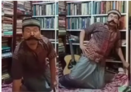
Gambar 3. Adegan Tokoh Guru kedatangan tamu tokoh Zetan

oleh tokoh Guru. Itu sebagaimana tampak pada gambar adegan berikut.