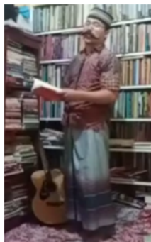
Gambar 2. Adegan Perkenalan Tokoh Guru

pertunjukan drama tersebut. Hal tersebut tampak pada dialog dan adegan pembuka pertunjukan drama monolog virtual berjudul Zetan yang distradarai dan diperankan oleh Roci Marciano. Pada awal, pertunjukan dibuka dengan adegan seorang tokoh bernama Guru yang memasuki ruang penuh buku dengan menggunakan peci hitam, baju batik berkerah, dan bersarung. Lalu, adegan dilanjutkan dengan perkenalan diri oleh tokoh Guru tersebut. Sebagaimana tampak pada gambar berikut.