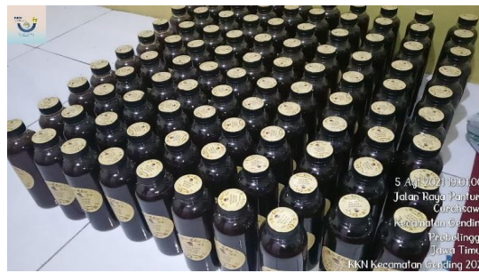
Gambar 5. Produk wedang pokak Jahe yang sudah dikemas

penambahan pendapatan dengan menjual wedang pokak di Desa Curah Sawo kecamatan Gending Kabupaten Probolinggo.