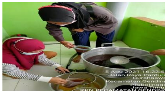
Gambar 4. Proses Pembuatan Wedang Pokak Jahe