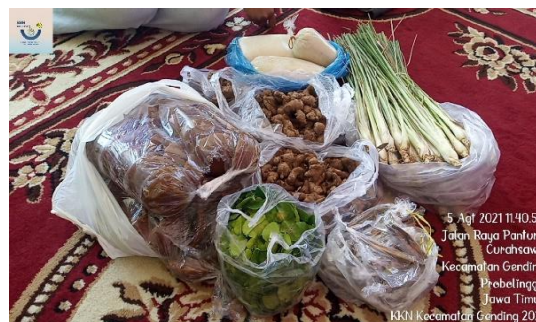
Gambar 2. Bahan-bahan pembuatan Wedang Pokak Ja

Hal pertama yang dilakukan dalam pembuatan Wedang Pokak Jahe yaitu dilakukan dengan survey lokasi. Survey lokasi ini digunakan untuk memilih tempat yang akan digunakan sebagai tempat pelaksanaan program, serta mendapat izin dari pemilik rumah dan aparat desa. Tahap yang kedua adalah mempersiapkan alat dan bahan yang dibutuhkan. Bahan-bahan yang digunakan mudah diperoleh dengan membeli di pasar tradisional terdekat. Bahan yang diperlukan untuk membuat Wedang Pokak Jahe adalah 2 kg jahe merah, 63 batang sereh, 45 lembar daun jeruk, kayu manis, 8 kg gula merah, dan 27 liter air. Alat yang dibutuhkan yaitu: Pisau, talenan, panci, saringan, botol, dan lain-lain.