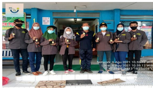
Gambar 6. Pendistribusian dan Penjualan Wedang Pokak Jahe pada Masyarakat Sekitar

Program pembuatan Wedang Pokak Jahe telah dilaksanakan di Desa Curahsawo dengan sasaran pendistribusian yaitu perangkat desa dan masyarakat yang ada di 5 desa yaitu Desa Curahsawo, Desa Pajurangan, Desa Gending, Desa Brumbungan Lor, dan Desa Klaseman. Dari kegiatan ini diharapkan masyarakat memahami tentang manfaat Wedang Pokak Jahe dalam meningkatkan imunitas tubuh apalagi saat ini terjadi peningkatan kasus Corona. Sehingga melalui program ini, sasaran distribusi dapat mengaplikasikan cara pembuatan wedang pokak jahe dalam rangka menjaga keluarga dan lingkungan dari Covid-19 melalui minuman yang dapat meningkatkan imun tubuh dan ilmu yang diperoleh dapat ditularkan kepada lingkungan yang lebih luas sehingga masyarakat Kecamatan Gending dapat terhindar dari penularan virus corona.