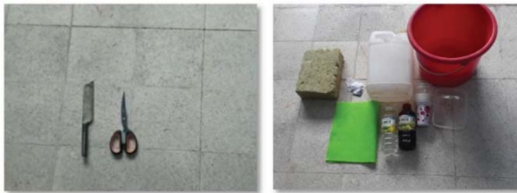
Gambar 5. Alat Gambar 6. Bahan