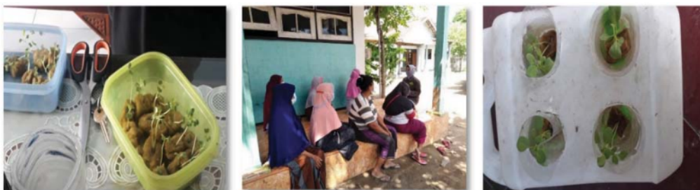
Gambar 7. Benih yang dидiamkan selama 1-2 minggu Gambar 8. Sosialisasi tentang hidroponik kepada para petani Gambar 9. Tanaman hidroponik

Dengan adanya kegiatan 31 sosialisasi tentang penerapan pertanian organik secara berkelanjutan dengan metode hidroponik ini, diharapkan dapat menambah pengetahuan dan wawasan bagi para petani. Selain itu, metode ini dapat menjadi solusi alternatif bagi para petani sehingga para petani tetap bisa produktif. Jadi, petani tidak perlu cemas akan lahan pertanian yang semakin sempit ditengah maraknya pembangunan.