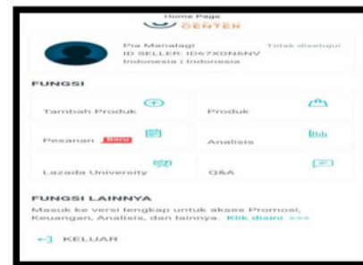
Gambar 6. Akun Lazada