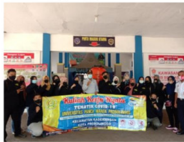
Gambar 1. Penyerahan Tempat Cuci Tangan