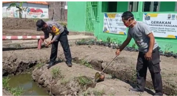
Gambar 2. Pengelolaan budidaya ikan lele

Pemberdayaan dalam arti sebuah proses dalam tatanan kehidupan masyarakat yang memiliki tujuan dalam memberikan sebuah wewenang atau kuasa 11 ( power ) kepada masyarakat yang sifatnya lemah ( powerless ), sehingga mengurangi kekuasaan ( disempowered ) kepada masyarakat yang sifatnya terlalu berkuasa ( powerful ) sehingga akan terjadi sebuah keseimbangan (Djohani, 2003). Dalam kaitannya dengan sebuah tolak ukur dalam keberhasilan pada suatu program pemberdayaan adalah dengan adanya sebuah partisipasi secara langsung dari tatanan masyarakat dengan sukarela dalam membantu kegiatan pembangunan. Misalnya semakin banyak partisipasi secara langsung dari masyarakat, maka semakin besar juga peluang masyarakat dalam menjadi seseorang yang berdaya. Maka, pemberdayaan tidak selalu terfokus pada hasil (output) saja melainkan juga menekankan pada setiap proses yang dijalankan dan hasil yang telah dicapainya.