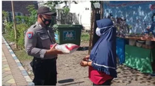
Gambar 4. Pembagian bahan pokok kepada masyarakat

Menurut Cook dan Macaulay, 12 dengan menggunakan konsep pada sebuah pemberdayaan maka yang ditawarkan dalam kerangka kerja teori ACTORS adalah input yang digunakan sudah diantisipasi sejak awal sehingga perubahan yang terjadi akan bersifat terencana dan mampu berdayaguna secara optimal. Fokus tulisan pada indikator dari keberhasilan (output) pada suatu proses 18 pemberdayaan masyarakat dengan menggunakan kerangka kerja dari ACTORS adalah sebagai berikut: