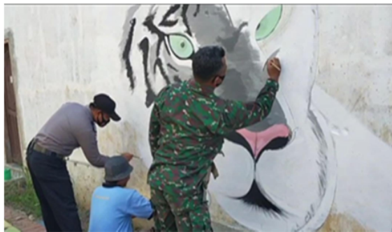
Gambar 3. Kegiatan di Kampung Tangguh Semeru

Landasan teori yang digunakan mengacu pada Teori ACTORS 6 oleh Sarah Cook dan Steve Macaulay. Teori tersebut mengacu berdasarkan pada proses (input) dan indikator dari hasil (output) keberhasilan pada suatu proses pemberdayaan masyarakat. Program Kampung Tangguh Semeru Wiro Secang merupakan sebuah program pemberdayaan masyarakat yang melibatkan partisipasi masyarakat secara langsung dan secara sukarela dalam kegiatan tersebut.