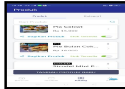
Gambar 5. Akun Tokko