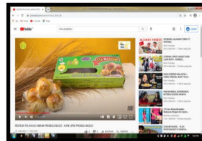
Gambar 7. Promosi Menggunakan Youtube