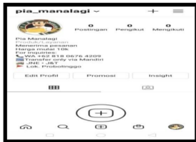
Gambar 3. Akun Instagram