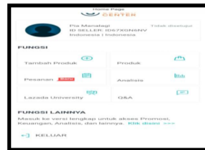
Gambar 6. Akun Lazada