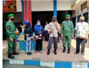
Gambar 2. Edukasi 3M Ke Pengunjung Terminal

menjaga jarak). Hal ini berguna untuk memberikan pengetahuan sehingga pengunjung terminal lebih waspada dan berhati-hati dalam melakukan aktivitas diluar rumah.