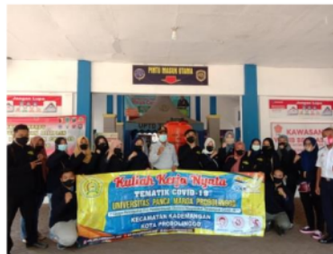
Gambar 1. Penyerahan Tempat Cuci Tangan