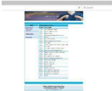
Gambar 4. Menu Daftar Gejala Penyakit

Pada menu Daftar Gejala terdapat input data nama-nama gejala dari semua penyakit dalam.