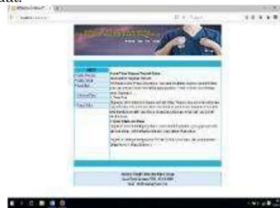
Gambar 2. Tampilan Awal

Implementasi antar muka menggambarkan tampilan dari aplikasi yang dibangun yaitu implementasi antar muka sistem pakar konsultasi penyakit dalam. Berikut ini adalah implementasi antar muka dari aplikasi yang di buat.