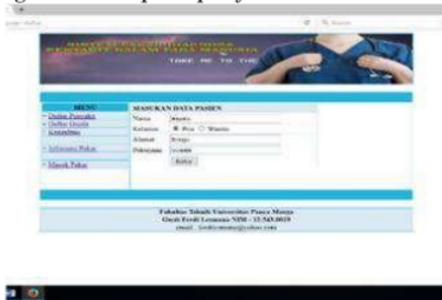
Gambar 5. Menu Konsultasi

Pada menu Konsultasi, pasien mengisi identitas pasien itu sendiri beserta keluhan apa yang dirasakan pada penyakit.