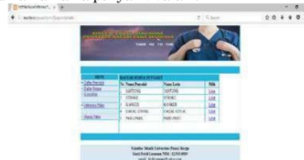
Gambar 3. Menu Daftar Penyakit Dalam

Pada menu Daftar Penyakit terdapat input data nama-nama penyakit dalam.