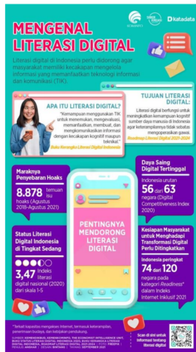
Gambar 1. Data informasi tentang kondisi literasi digital di Indonesia oleh Kominfo (Wibowo, 2021)

menjadi permasalahan yang serius mengingat tingginya tuntutan digitalisasi yang jauh meningkat akibat pandemi Covid-19 .