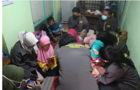
Gambar 3. Proses bimbingan belajar pada siswa-siswi SD Miftahul Ulum

alat tulis menulis disediakan untuk siswa-siswi. Selain itu, sistem pembelajaran dengan kuis berhadiah diterapkan untuk menambah semangat siswa-siswi dalam mengejar ketertinggalan materi.