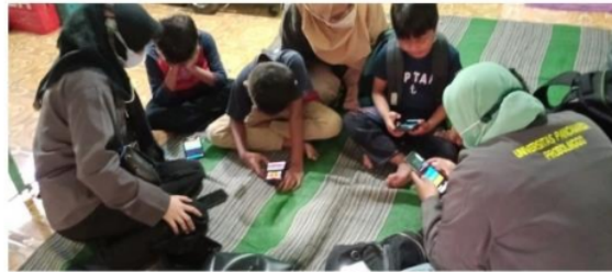
Gambar 4. Pendampingan siswa-siswi sekolah dasar dalam literasi digital

Pendampingan belajar tentang literasi digital kepada siswa-siswi sekolah dasar bertujuan untuk meningkatkan kemampuan siswa-siswi dalam mengoperasikan gawai maupun memahami media digital dengan baik dan benar. Memberikan edukasi mengenai beberapa aplikasi gawai dan etika dalam penggunaannya. Mengenalkan sistem informasi yang bisa dijangkau oleh internet. Membagikan BSE yang dapat dibuka dan dibaca dimana saja melalui gawai. Mengajari dalam penggunaan media komunikasi yang baik dan benar. Memberikan motivasi untuk dapat terus belajar dalam menggunakan media digital atau teknologi. Hal ini akan memberikan kemampuan adaptasi siswa-siswi terhadap digitalisasi yang berkembang secara cepat dan terus menerus. Temuan yang menarik pada tahap ini, bahwa tidak hanya siswa-siswi yang ingin meningkatkan literasi digitalnya tetapi juga guru sekolah dasar juga.