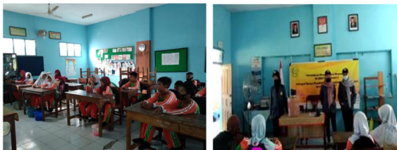
Gambar 5. Pelaksanaan Kegiatan Pemaparan Pembentukan Karakter Dan Melatih Kebiasaan Menabung Sejak Dini

meraih impian harus diawali dengan niat dan usaha. Kemudian juga dijelaskan bahwa kebiasaan menabung sejak dini merupakan langkah awal meraih kesuksesan untuk mempersiapkan merealisasikan impian para peserta. Dokumentasi kegiatan dapat diamati pada Gambar 5.