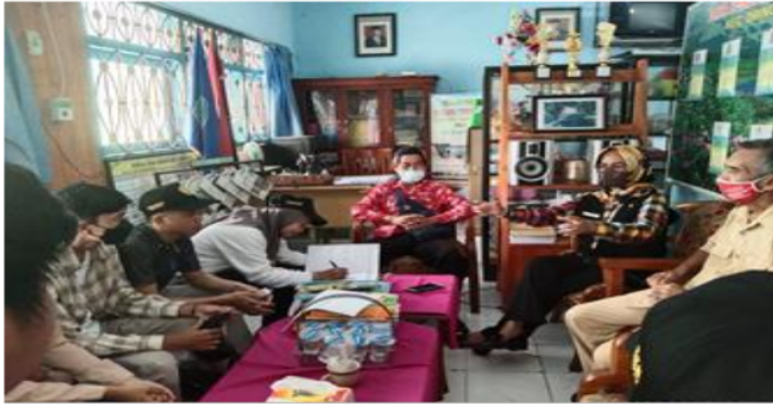
Gambar 2. Perizinan Kepada Pihak Sekolah Sebagai Persiapan Acara

Hasil wawancara dengan pihak sekolah menghasilkan beberapa permasalahan pada manajemen keuangan anak, permasalahan tersebut antara lain: