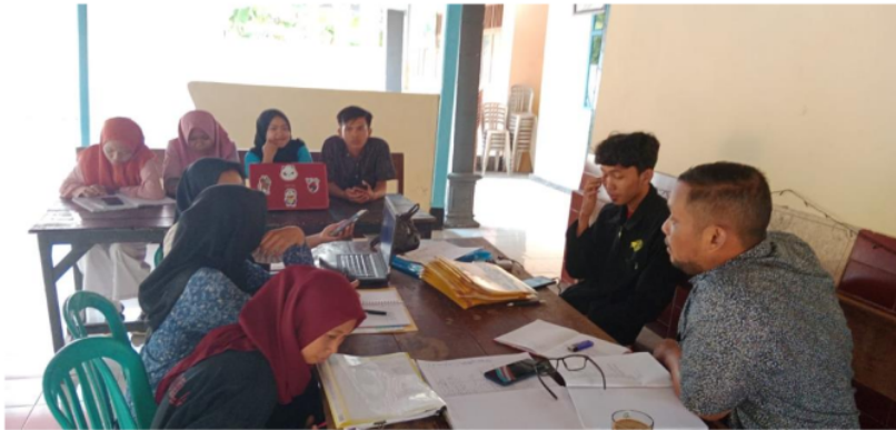
Gambar 3. Rapat internal tahap identifikasi

Tahap identifikasi dilakukan dengan tim internal pengabdian kepada masyarakat Universitas Panca Marga. Dokumentasi kegiatan identifikasi dapat diamati pada Gambar 3 dan kegiatan persiapan media pada Gambar 4.