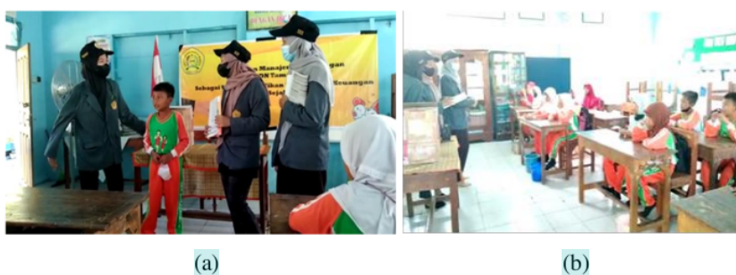
Gambar 6. Pengujian pemahaman teori kepada peserta

Setelah pemaparan pembentukan karakter dan melatih kebiasaan menabung sejak dini. Untuk menguji pemahaman peserta dilakukan pertanyaan kepada beberapa peserta. Pertanyaan tersebut berupa komitmen peserta sepulang sekolah apakah akan menabung, kemudian dilanjutkan dengan pertanyaan pengeluaran apa saja yang akan dicatat pada setiap harinya. Tujuan sesi pemberian pertanyaan adalah untuk mengamati dan menilai pemahaman serta komitmen peserta. Hal ini sebagai dasar untuk mengukur keberhasilan acara pengabdian terkait dengan permasalahan yang telah ditemukan saat wawancara dengan pihak sekolah. Dokumentasi pengujian pemahaman peserta dapat diamati pada Gambar 6.