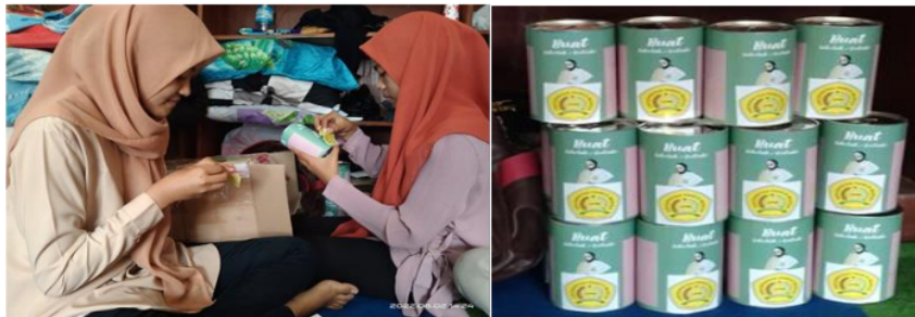
(a) (b) Gambar 4. (a) Persiapan media tempat untuk menabung (b) Media