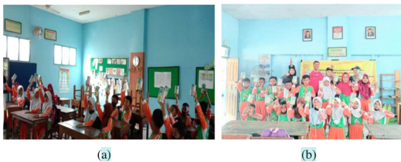
Gambar 7. (a) Komitmen peserta untuk menabung sesuai pilang sekolah (b) Evaluasi kegiatan dengan guru

Tahap evaluasi dilakukan setelah tahap kegiatan telah dilaksanakan. Pada tahap evaluasi dilakukan pengamatan terhadap pemahaman dan komitmen peserta dalam manajemen keuangan dan pencatatan pengeluaran pada kehidupan sehari-hari. Hasil pengamatan siswa-siswi memiliki komitmen untuk menabung dengan menyisihkan uang saku serta menulis pengeluaran harian sesuai pulang sekolah. Hal ini dapat diketahui melalui tanya jawab dengan peserta khususnya siswa-siswi kelas III SDN Tamansari 1 bahwa mereka ingin membeli suatu barang dengan hasil menabung. Selain itu, pemberian media untuk menabung menambah semangat siswa-siswi untuk giat dalam menabung dan fokus pada impian masing-masing. Terlihat siswa yang cenderung menghabiskan uang saku sesuai pulang sekolah telah menyadari bahwa hal yang dilakukan adalah kurang tepat. Hal ini diketahui saat proses tanya jawab antara pemateri dengan peserta. Namun, tanpa adanya pengawasan dari guru kelas maka kegiatan pengabdian tentang manajemen keuangan anak sejak dini tidak akan berjalan dengan baik. Oleh karena itu, diperlukan peran guru kelas atau wali kelas dalam pengawasan kedepannya sehingga siswa-siswi tetap melakukan kegiatan menabung dalam kehidupan sehari-hari. Dokumentasi kegiatan dapat diamati pada Gambar 7.