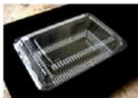
Gambar 3. Kemasan dalam bentuk mika

Bakpia ditata dalam isian 10 biji lalu dikemas dengan mika plastik kemudian diberi label khas produk Bakpia "Kirana". Sebagian produk yang dijual langsung ke konsumen, juga dijual melalui toko pengecer atas nama label Bakpia Kirana. Tapi pada umumnya dalam penjualan lebih banyak memakai kemasan mika plastik karena keterbatasan kemasan serta kurangnya rasa percaya diri dari pengelola untuk memperjual Bakpia dalam kemasan yang lebih besar dan lebih banyak isi di dalamnya. Jadi pengelola menginginkan kemasan produk Bakpia "Kirana" yang dibedakan dalam dua jenis yaitu kemasan mika plastik yang berisikan 10 Biji Bakpia dan Kotak Karton dengan ukuran berbeda dan berat serta isi yang berbeda pula.