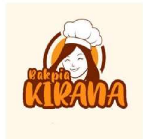
Gambar 2. Merk setelah Pembaharuan