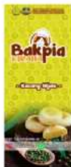
Gambar 6. Xbanner sebagai media promosi non digital

Secara umum, kegiatan promosi untuk produk makanan ringan produk home industry ini dilakukan terutama dalam bentuk komunikasi dari individu ke individu ( personal selling ). Jika dilihat dari model periklanan yang terjadi, ini mengikuti sebuah model dari promosi publik relations release yaitu suatu tujuan bisnis adalah untuk menciptakan kondisi para pelanggan yang merasa puas. Terciptanya kepuasan pelanggan dapat memberikan beberapa manfaat, diantara hubungan antara perusahaan dan pelanggan menjadi harmonis, memberikan dasar yang baik bagi pembelian ulang, dan terciptanya loyalitas pelanggan, sehingga membentuk suatu rekomendasi dari mulut kemulut ( word of mouth ) yang menguntungkan bagi perusahaan (Tjiptono, 1997).