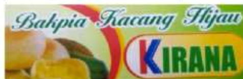
Gambar 1. Merk Sebelum Pembaharuan

Awal nama merek yang ada dalam produk adalah "Bakpia Kacang Hijau KIRANA", setelah mendapat ijin untuk pembaharuan ulang merek produk, jadi diubahlah menjadi bakpia "KIRANA", dimana memfokuskan bakpia pada nama produk itu sendiri. Pemberian merek dari Bakpia "Kirana" berawal dari kreativitas pemilik usaha untuk menciptakan nama produk dengan mencantumkan nama anaknya dalam produk agar mudah diketahui masyarakat. Saat ini merek dari Bakpia "Kirana" sudah cukup dikenal oleh masyarakat, tetapi dalam masa pandemi Covid-19 ini, pesanan yang diterima oleh pengelola Bakpia "Kirana" mengalami penurunan. Produk Bakpia "Kirana" belum memiliki perluasan lini produk seperti variasi rasa dan bentuk produk.