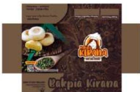
Gambar 5. Label setelah Pembaharuan