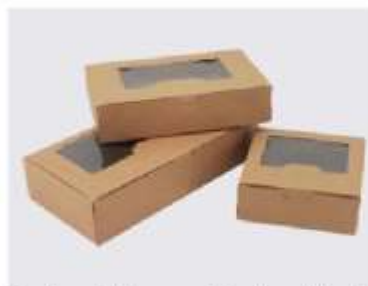
Gambar 4. Kemasan dalam bentuk kardus