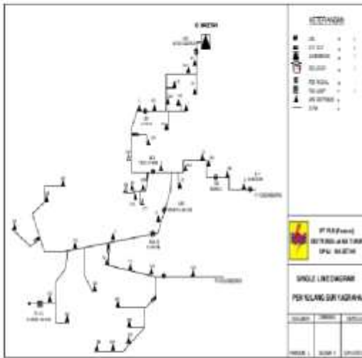
Gambar 1. Single line penyulang Suryagraha .