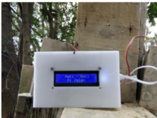
Gambar 6. Tampilan Layar LCD Saat Sensor Menerima Input

Pada Gambar 6 layar LCD menampilkan "Selamat Datang di RT 03" karena alat ini dipasang pada tikungan jalan yang terletak di RT 03. Sedangkan Pada Gambar 6 layar LCD menampilkan "Hati-hati di jalan" karena sensor telah menerima input yaitu ada yang melintasi sensor.