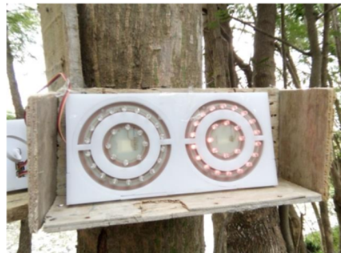
Gambar 8. Tampilan LED Merah

Pada Gambar 8 menandakan bahwa tidak ada kendaraan yang melintas pada arah berlawanan. Sedangkan Gambar 7 menandakan bahwa ada kendaraan yang melintas pada arah berlawanan.