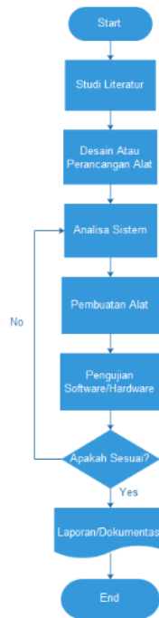
1 Gambar 1. Diagram Alir Penelitian