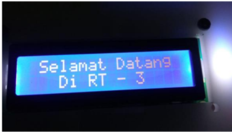
Gambar 5. Tampilan Awal Layar LCD

Berikut ini merupakan tampilan layar LCD pada saat sistem mulai dinyalakan.