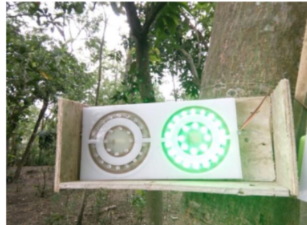
Gambar 7. Tampilan LED Hijau

Berikut ini merupakan tampilan LED pada saat bagian slave menerima input dari sensor yang dipasang 10 m sebelum tikungan.