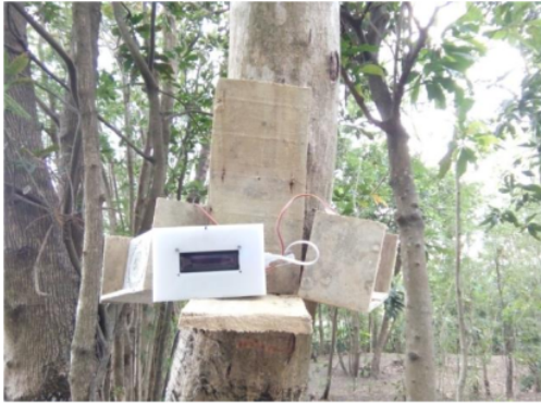
Gambar 4. Pemasangan Posisi Rangkaian Master