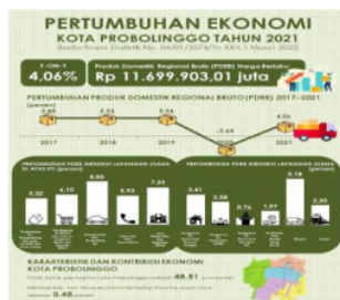
Gambar. 3 Laju Pertumbuhan Ekonomi Melalui Statistik Data Kota Probolinggo Tahun 2021