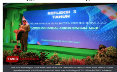
Gambar. 4 Tiga Tahun Memimpin, Wali Kota Probolinggo Buktikan dengan Prestasi

biasa. Terhitung ada 14 penghargaan di berbagai bidang, 7 dari penghargaan tersebut dari tingkat nasional dan 7 penghargaan lainnya dari tingkat regional. Wali Kota Habib Hadi Zainal Abidin mengatakan, pencapaian tersebut menunjukkan komitmen pemerintah dalam melayani masyarakat. Dengan pencapaian tersebut walikota Habib Hadi berkomitmen untuk membenahi dan mengoreksi kekurangan-kekurangan pemerintah. Tujuannya bukan hanya pencapaian, tetapi juga untuk kepentingan masyarakat. Untuk itu, beliau berharap semua lapisan masyarakat dapat mendorong dan mengingatkan bahwa pencapaian ini berkat kekompakan semua pihak ( Tiga Tahun Memimpin, Wali Kota Probolinggo Buktikan Dengan Prestasi , 2022).