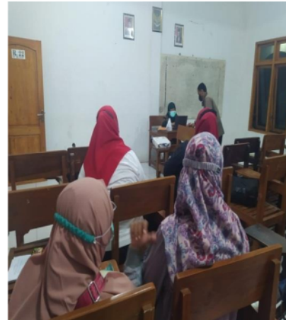
Gambar 3: Kegiatan Diskusi

Hasil akhir dari program pengabdian kepada masyarakat dengan tema Penyuluhan Tentang Menggali Jiwa Kepemimpinan Dalam Berorganisasi Di Era 4.0 Untuk Kalangan Mahasiswa Pekerja kepada para mahasiswa pekerja di lingkungan kampus berjalan dengan baik dan lancar. Antusias mahasiswa sangat besar, terlihat peserta antusias berdiskusi, beberapa peserta tertarik menceritakan pengalaman, lainnya memberikan tanggapan pada permasalahan tersebut.