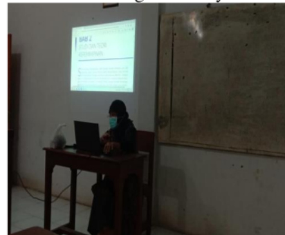
Gambar 1 : Kegiatan Penyuluhan

Bagian kedua adalah diskusi. Bagian penyuluhan yang telah dilakukan, maka dilanjutkan dengan sesi diskusi. Mahasiswa mengajukan pertanyaan terkait materi kepemimpinan di era digital dan narasumber yang menjawab, serta mahasiswa lain boleh untuk menyanggah atau menambahkan sesuai argumen ilmiah yang relevan.