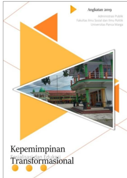
Gambar 5: Sampul E-book