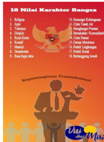
Gambar 4: Flyer Kepemimpinan Transformasional Berbasis Karakter Untuk Penguatan Nilai Pancasila

13 dan mahasiswi untuk membiasakan diri dan mempersiapkan diri untuk menjadi pemimpin di masa depan yang ideal untuk lingkungan dan organisasi. Pembagian flyer bertujuan mahasiswa dan mahasiswi terbiasa dengan nilai dasar kepemimpinan yang berasaskan nilai Pancasila. Flyer tidak hanya dibagikan pada mahasiswa-mahasiswi yang hadir, tetapi juga di tempelkan pada masing kampus.