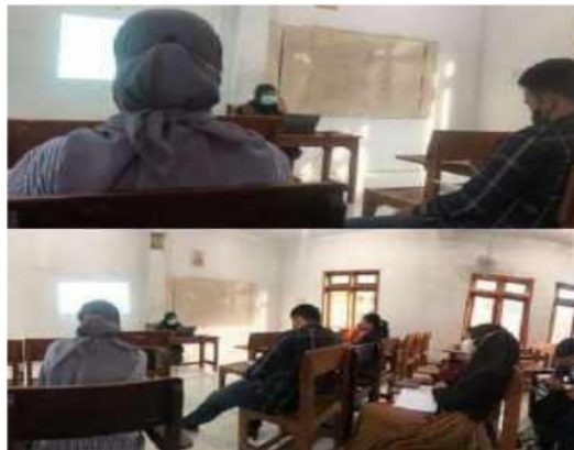
Gambar 2: Kegiatan Pengabdian Kepada Masyarakat

Pengabdian Kepada Masyarakat. Kegiatan selanjutnya adalah sosialisasi tentang Kepemimpinan Transformasional Berbasis Karakter Untuk Penguatan Nilai Pancasila yang dilakukan oleh narasumber. Kegiatan sosialisasi mendapat masukan sangat baik dan mahasiswa antusias menerima materi. Hal itu terlihat dari ekspresi mahasiswa yang terus mendengarkan materi pembicara bahkan mahasiswa mencatat point-point penting yang disampaikan.