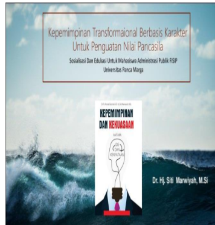
Gambar 3: Slide presentasi pembuka sosialisasi

dengan 18 Karakter kepemimpinan yang sesuai dengan Nilai Pancasila. Berikut isi materi Kepemimpinan Transformasional Berbasis Karakter Untuk Penguatan Nilai Pancasila.