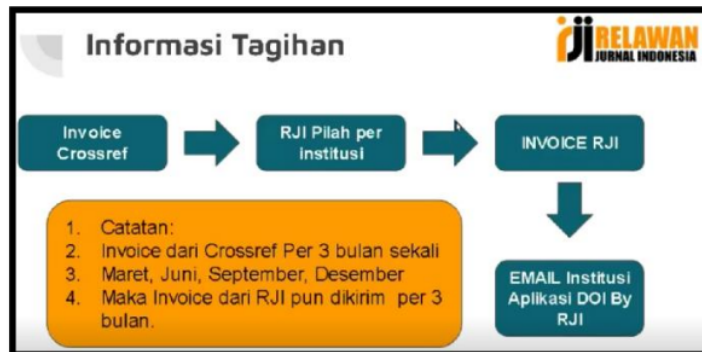
Gambar 4: Alur Metode Pembayaran DOI melalui RJI