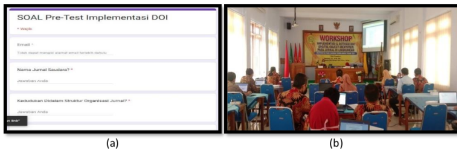
Gambar 2: (a) Form Pre-Test peserta melalui google form, (b) Praktik langsung aktivasi DOI oleh pengelola jurnal,