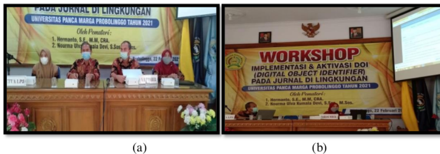
Gambar 1: (a) Kegiatan workshop aktivasi DOI dibuka oleh Rektor Universitas PMG, (b) Pemateri Workshop memberikan arahan materi

mumpuni (Paskin, 2009: 16). Sistem Digital Object Identifier cara kerjanya berupa indeks dalam database akademik yang berskala dengan sistem kerja seperti mesin pencari web atau Google Scholar. Penyematan DOI bertujuan sebagai identitas pengenal atau simbol suatu dokumen dibidang karya ilmiah yang digitalisasikan sehingga bersifat unik dan tetap ( persistent ). Selain itu fungsi aktivasi DOI membantu pengelolaan sumber daya digital, terutama berkaitan dengan hak cipta dan hak kekayaan intelektual (KI). Kemudian untuk keperluan perpustakaan digital, DOI juga dipakai sebagai bagian dari metadata untuk pengelolaan sumber daya digital, misalnya artikel jurnal elektronik. Pihak Koordinator yang mengawasi pemberian identitas digital ini adalah International DOI Foundation (IDF) ( http://www.doi.org/ ), yang memiliki kantor registrasi atau pendaftaran nomor DOI di Negara Amerika Serikat, Eropa, dan Australia.