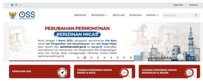
Gambar 4. Tampilan Laman url : https://oss.go.id/ dan kolom daftar berada di pojok atas

Dalam melakukan praktek pendaftaran izin usaha melalui laman OSS Bapak Ruslan Fauzi, S.Pd. sebagai narasumber memberikan tahapan alur dalam pembuatan izin usaha. Tahapan pengajuan perizinan usaha melalui online yaitu : 1. Mengunjungi laman url : https://oss.go.id/ klik tombol daftar dipojok kanan atas. 2. Pilih menu UMK. 3. Pilih jenis usaha, masukkan nomor handphone aktif, dan email aktif 4. Kirim kode verifikasi melalui email (disarankan) 4. Konfirmasi dan ikuti langkah yang diminta oleh sistem 5. Cetak izin usaha yang telah disetujui.