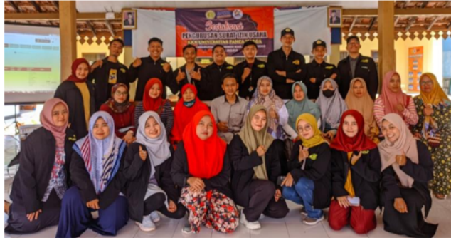
Gambar 8. Foto bersama narasumber, mahasiswa KKN, dan pelaku UMKM

keunggulan produk dalam bersaing, dan meningkatkan kepercayaan konsumen terhadap kualitas produk.