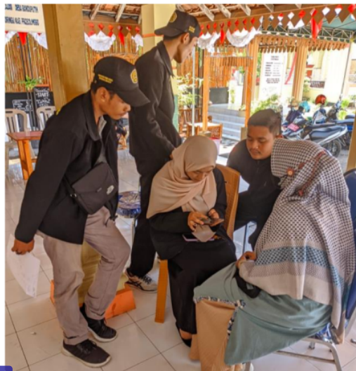
Gambar 2. Praktek pembuatan izin usaha melalui OSS oleh narasumber