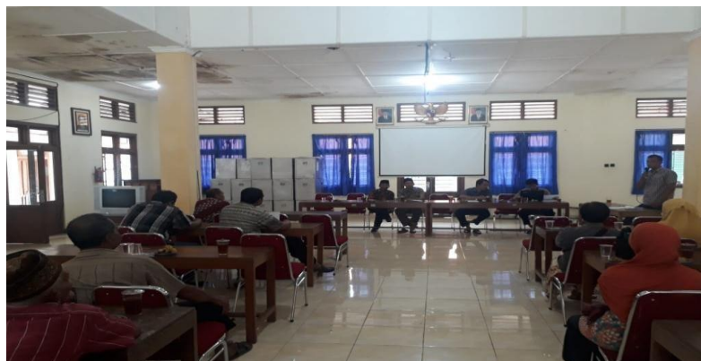
Gambar 1.2 Proses Lelang Tanah Kas Desa

Kegiatan proses lelang tanah kas desa dilaksanakan pada tanggal 2 Maret 2022 bertempat di Aula Desa Patalan dengan di hadiri 23 peserta, dan diawasi oleh Lembaga perwakilan dari BPD dan Tokoh masyarakat. Proses kegiatan lelang yang berlangsung dilakukan dengan lelang umum dimana untuk kriteria pemenang lelang masing-masing dari peserta lelang mengisi terkait lokasi serta harga sewa yang akan dilelang. Pada proses lelang ini harga sewa yang dicantumkan ialah antara Rp.12.000- Rp 18.000 dengan melihat dari kelas tanah kas desa yang ada di Desa