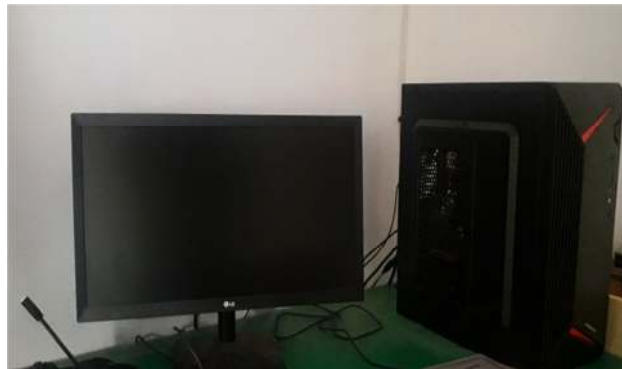
Gambar 3.2 Komputer/Laptop