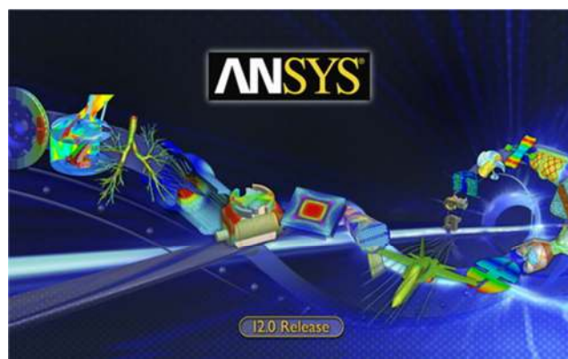
Gambar 3.3 Aplikasi Ansys