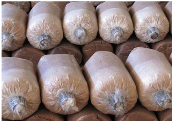
Gambar 3.5 Baglog Jamur