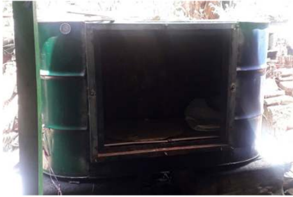
Gambar 3.4 Alat Sterilisasi