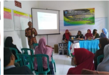
Pemateri Legalitas Usaha