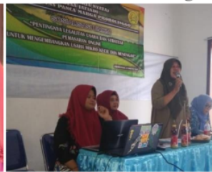
Pemateri Penjualan online