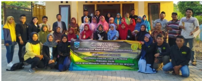
Foto Bersama Peserta, Panitia dan Pemateri