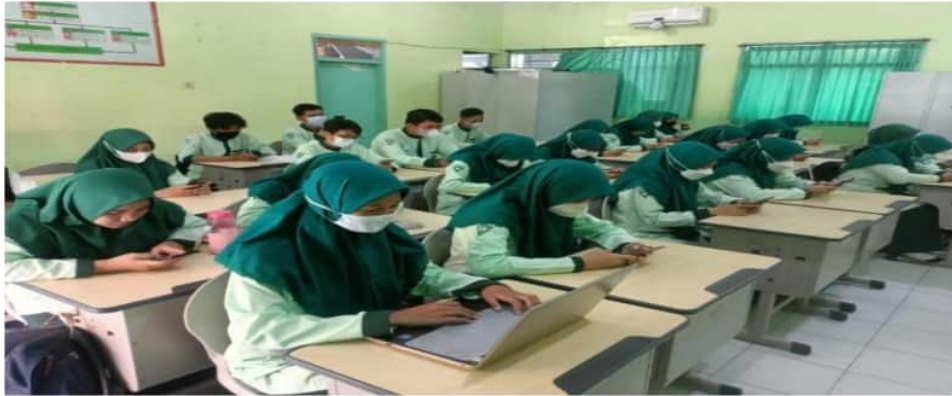
Gambar 6. Kegiatan Post-test

Pada tahap akhir pelaksanaan pelatihan yang telah dilakukan, siswa terlihat sudah paham dalam menyusun sebuah 7 proposal yang meliputi judul, latar belakang masalah, tujuan, manfaat, dan metode penelitian dengan benar. Berikut adalah perbandingan kompetensi siswa-siswi 2 MAN 2 Kota Probolinggo sebelum dan sesudah mengikuti pelatihan teknik penulisan karya ilmiah.