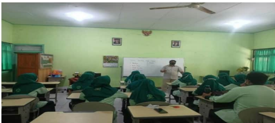
Gambar 2. Pemaparan Materi Pelatihan

Kegiatan kedua adalah praktik menyusun proposal karya ilmiah secara kelompok. Peserta dibagi menjadi 6 kelompok. Setiap kelompok menyusun 7 proposal yang berisi judul, latar belakang masalah, tujuan, manfaat, dan metode penelitian. Kegiatan ini didampingi penuh oleh tim pelaksana. Siswa saling bertukar pendapat dengan teman sekelompok dalam menentukan tiap item proposal. Tugas pendamping adalah memberikan arahan agar proposal yang disusun sesuai dengan ketentuan yang terdapat di materi kegiatan pertama.