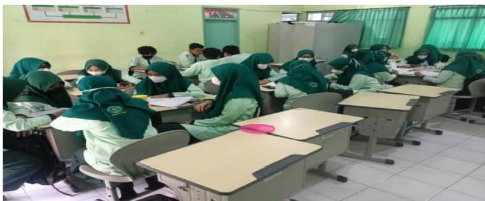
Gambar 3. Peserta Menyusun Proposal

Kegiatan kedua adalah praktik menyusun proposal karya ilmiah secara kelompok. Peserta dibagi menjadi 6 kelompok. Setiap kelompok menyusun 7 proposal yang berisi judul, latar belakang masalah, tujuan, manfaat, dan metode penelitian. Kegiatan ini didampingi penuh oleh tim pelaksana. Siswa saling bertukar pendapat dengan teman sekelompok dalam menentukan tiap item proposal. Tugas pendamping adalah memberikan arahan agar proposal yang disusun sesuai dengan ketentuan yang terdapat di materi kegiatan pertama.