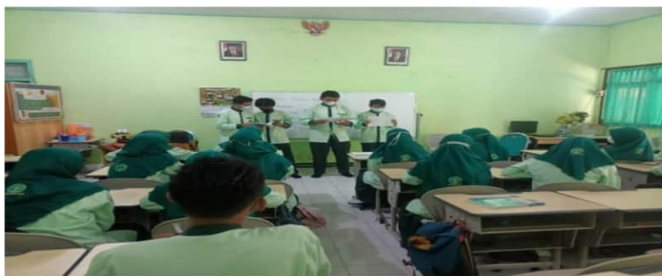
Gambar 5. Kegiatan Presentasi Proposal

Kegiatan ketiga adalah mempresentasikan proposal hasil diskusi dari tiap kelompok. Peserta mempresentasikan di depan kelas. Tim pelaksana menanggapi langsung dan memberikan koreksi jika terdapat kesalahan. Kegiatan tahap ini memberikan motivasi yang besar untuk siswa dalam penyusunan proposal. Terlihat ada 10 siswa yang aktif bertanya ketika teman kelompok lain mempresentasikan proposal dan siswa aktif mencatat hasil koreksi dari tim pelaksana.