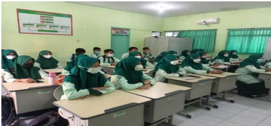
Gambar 1. Kegiatan Pre-test

materi oleh tim pelaksana. Materi yang disampaikan adalah tentang teknik penulisan karya ilmiah, trik-trik cepat pencarian informasi yang berkaitan dengan artikel jurnal, buku, makalah, dan sebagainya di internet. Peserta menyimak dengan hikmat dengan sesekali bertanya ketika ada materi yang belum jelas untuk dipahami. Materi yang diberikan merupakan materi baru bagi peserta. Siswa belum pernah belajar tentang karya ilmiah, mulai dari pengertian; langkah-langkah dalam menyusun; dan cara mempublikasikannya.