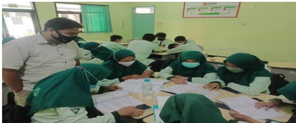
Gambar 4. Mentoring Penyusunan Proposal

Kegiatan ketiga adalah mempresentasikan proposal hasil diskusi dari tiap kelompok. Peserta mempresentasikan di depan kelas. Tim pelaksana menanggapi langsung dan memberikan koreksi jika terdapat kesalahan. Kegiatan tahap ini memberikan motivasi yang besar untuk siswa dalam penyusunan proposal. Terlihat ada 10 siswa yang aktif bertanya ketika teman kelompok lain mempresentasikan proposal dan siswa aktif mencatat hasil koreksi dari tim pelaksana.