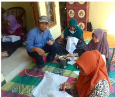
Gambar 7 : Praktek Membuat