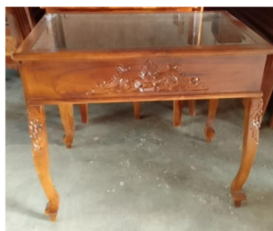
Gambar 4 : Meja Gambar Batik