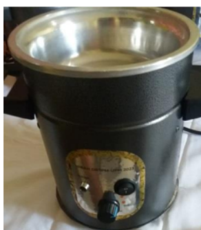
Gambar 3 : Kompor Batik Listrik

Untuk merealisasikan peralatan tersebut selanjutnya dilakukan pembuatan peralatan sesuai dengan desain yang telah dibuat. Peralatan Meja gambar dibuat di pengrajin mebel yang ada di Desa Leces probolinggo, sedangkan Pembuatan Kompor Batik Listrik dibuat di Workshop peralatan Batik yang berlokasi di Bantul, Yogyakarta.