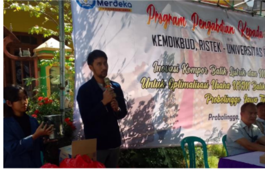
Gambar 6 : Materi Pelatihan