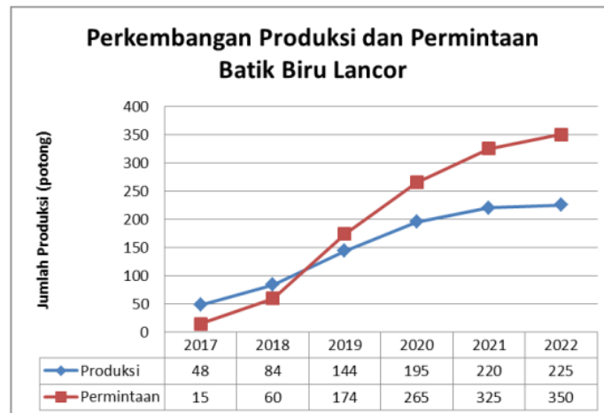
Grafik 1 : Perkembangan Produksi dan Permintaan

Dalam perkembangannya, produk Batik yang dihasilkan mendapat respon yang cukup baik dari konsumen. Bahkan beberapa instansi memesan seragam batik tulis, seperti beberapa kantor Dinas di Kabupaten Probolinggo, beberapa SMP dan SMA di kawasan Kabupaten dan Kota Probolinggo juga menjadi pelanggannya. Dalam even pameran yang diadakan oleh Dinas Perindustrian Kabupaten Probolinggo, penampilan Batik Tulis Biru Lancor juga mendapat respon positif dari pengunjung, bahkan juga mendapat apresiasi dari desainer batik nasional. Usaha yang dirintis sejak tahun 2017 ini berjalan dengan baik, perkembangan jumlah produksi dan permintaan produk Batik Biru Lancor dapat dilihat dalam grafik 1 berikut :