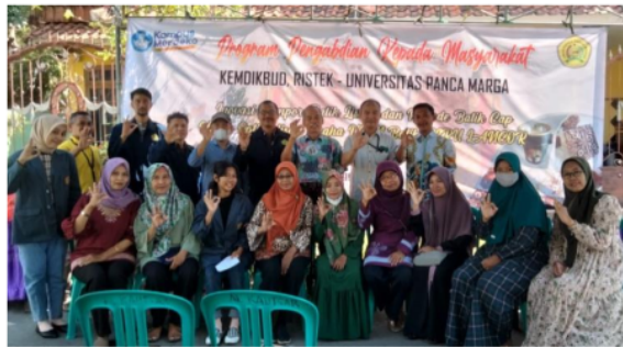
Gambar 8 : Peserta Pelatihan