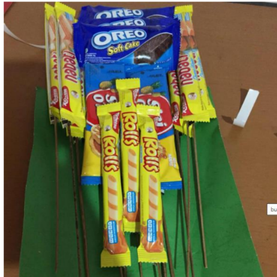
Gambar 3. Pembungkusan dengan kertas karton