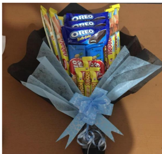
Gambar 4. Pemasangan pita