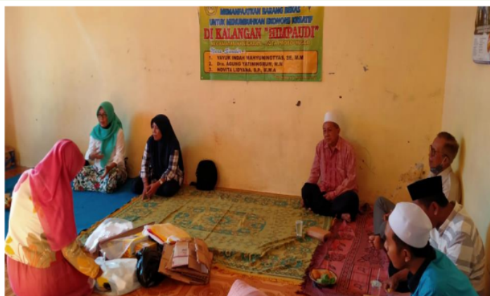
Gambar 1. Pelaksanaan Penyuluhan

Hasil dari pemberian penyuluhan manfaat daur ulang sampah, memberikan wawasan bagi peserta pelatihan yakni guru-guru di kalangan HIMPAUDI Kecamatan Kanigaran, bahwanya penyumbang sampah terbesar berasal dari rumah tangga. Untuk itu menjadi sangat penting kesadaran masyarakat untuk meminimalkan sampah, setelah sharing tentang bahayanya sampah jika dibiarkan. Sampah memang menjadi ancaman jika tidak dikelola dengan baik, tetapi sampah juga bisa mendatangkan manfaat jika dikelola dengan baik.