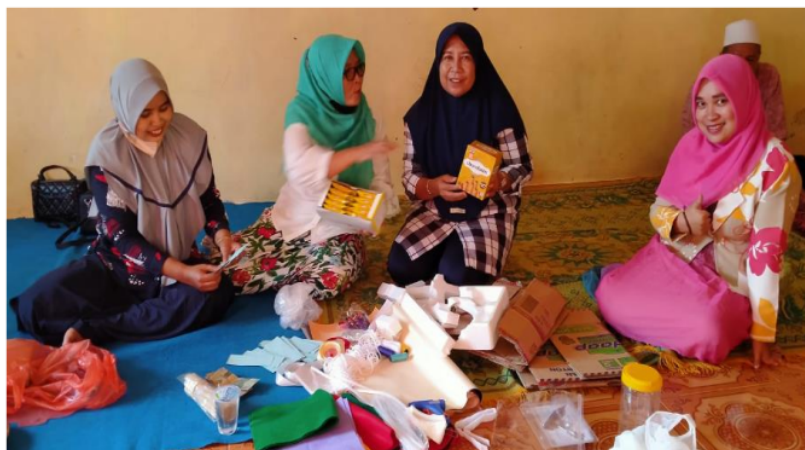
Gambar 2. Proses Pembuatan Kreativitas Barang Bekas

Pengelolaan sampah secara efektif merupakan tugas dan tanggung jawab masyarakat, karena masyarakatlah yang menghasilkan sampah. Beberapa program telah diluncurkan oleh pemerintah dalam pengelolaan sampah, namun volume sampah tetap saja meningkat dari waktu ke waktu sehingga butuh perhatian khusus untuk mengelola sampah. Salah satu bentuk pengelolaan sampah adalah dengan 16 memisahkan sampah mulai dari rumah tangga, dipilah berdasarkan jenis sampah yaitu sampah organik dan sampah non organik. Sampah non organik yang berbahan baku kertas, kardus misalnya. Dengan sedikit sentuhan kreatifitas, barang bekas/ sampah dirubah wujud dan bentuknya, tidak saja mendukung program minim sampah tetapi lebih pada menumbuhkan ekonomi kreatif masyarakat yang harapannya dapat dikembangkan menjadi ekonomi produktif sebagai tambahan penghasilan keluarga.