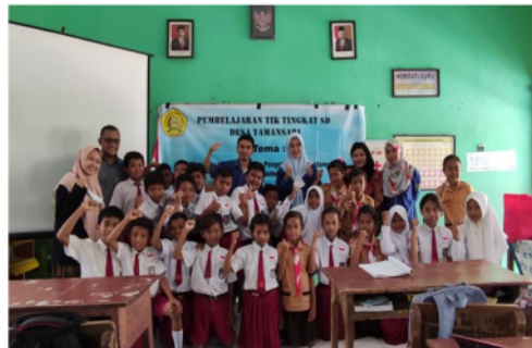
Gambar 9. Sesi Penutup dengan Foto Bersama

Setelah sesi praktik, acara dilanjutkan dengan sesi penutup. Sesi penutup dilakukan dengan sesi foto bersama dengan seluruh peserta. Dokumentasi dapat dilihat pada Gambar 9.