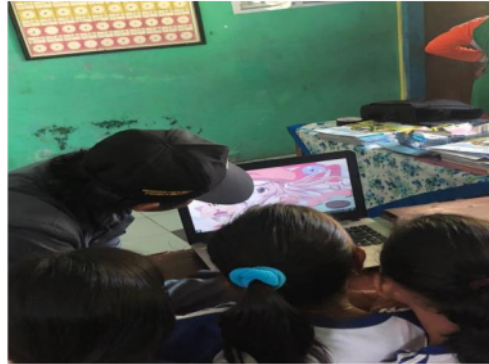
Gambar 8. Sesi Praktik

Dokumentasi sesi praktik dapat dilihat pada Gambar 8.