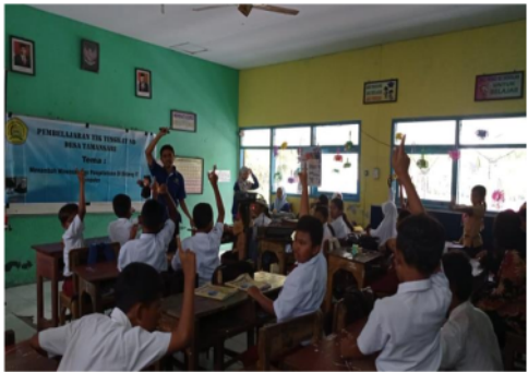
Gambar 6. Sesi Tanya Jawab