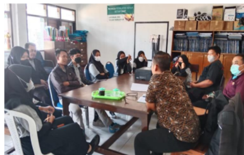
Gambar 1. Rapat Internal