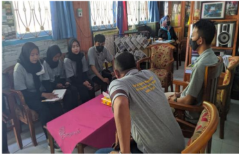
Gambar 2. Wawancara dengan pihak dewan guru