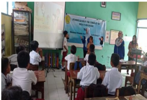
Gambar 7. Penyerahan Hadiah

Setelah pemaparan teori, acara dilanjutkan dengan sesi praktik. Pada sesi praktik setiap peserta diajarkan pengenalan fitur-fitur pada komputer. Kemudian, peserta diajarkan penggunaan microsoft office. Peserta mengikuti acara dengan antusias. Hal ini ditunjukkan dengan keingin tahaun peserta saat mencoba mempraktikkan penggunaan aplikasi.