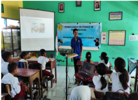
Gambar 5. Sesi Pemaparan Teori