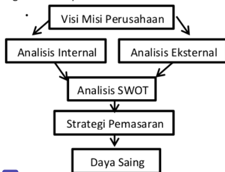
47 Gambar 1 Kerangka Pikir Penelitian

Adapun kerangka pikir penelitian digambarkan pada Gambar 1.