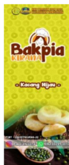
Gambar 6. Xbanner sebagai media promosi non digital

Secara umum, kegiatan promosi untuk produk makanan ringan produk home industry ini dilakukan terutama dalam bentuk komunikasi dari individu ke individu ( personal selling ). Jika dilihat dari model periklanan yang terjadi, ini mengikuti sebuah model dari promosi publik relations release yaitu suatu tujuan bisnis adalah untuk menciptakan kondisi para pelanggan yang merasa puas. Terciptanya kepuasan pelanggan dapat memberikan beberapa manfaat, diantara hubungan antara perusahaan dan pelanggan menjadi harmonis, memberikan dasar yang baik bagi pembelian ulang, dan terciptanya loyalitas pelanggan, sehingga membentuk suatu rekomendasi dari mulut kemulut ( word of mouth ) yang menguntungkan bagi perusahaan (Tjiptono, 1997).