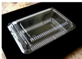
Gambar 3. Kemasan dalam bentuk mika

Bakpia ditata dalam isian 10 biji lalu dikemas dengan mika plastik kemudian diberi label khas produk Bakpia “Kirana”. Sebagian produk yang dijual langsung ke konsumen, juga dijual melalui toko pengecer atas nama label Bakpia Kirana. Tapi pada umumnya dalam penjualan lebih banyak memakai kemasan mika plastik karena keterbatasan kemasan serta kurangnya rasa percaya diri dari pengelola untuk memperjual Bakpia dalam kemasan yang lebih besar dan lebih banyak isi di dalamnya. Jadi pengelola menginginkan kemasan produk Bakpia “Kirana” yang dibedakan dalam dua jenis yaitu kemasan mika plastik yang berisikan 10 Biji Bakpia dan Kotak Karton dengan ukuran berbeda dan berat serta isi yang berbeda pula.