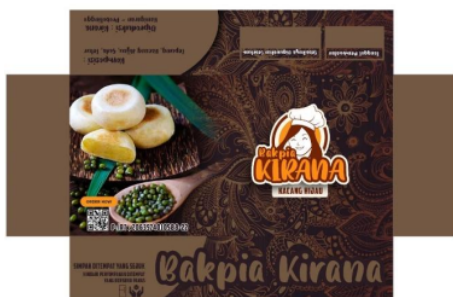
Gambar 5. Label setelah Pembaharuan