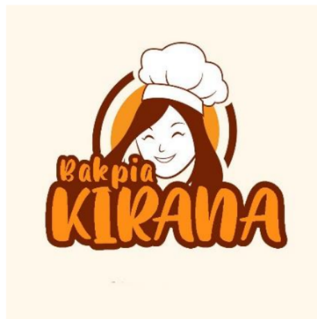
Gambar 2. Merk setelah Pembaharuan