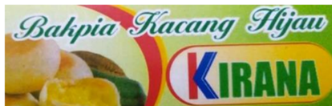
Gambar 1. Merk Sebelum Pembaharuan

Awal nama merek yang ada dalam produk adalah "Bakpia Kacang Hijau KIRANA", setelah mendapat ijin untuk pembaharuan ulang merek produk, jadi diubahlah menjadi bakpia "KIRANA", dimana memfokuskan bakpia pada nama produk itu sendiri. Pemberian merek dari Bakpia "Kirana" berawal dari kreativitas pemilik usaha untuk menciptakan nama produk dengan mencantumkan nama anaknya dalam produk agar mudah diketahui masyarakat. Saat ini merek dari Bakpia "Kirana" sudah cukup dikenal oleh masyarakat, tetapi dalam masa pandemi Covid-19 ini, pesanan yang diterima oleh pengelola Bakpia "Kirana" mengalami penurunan. Produk Bakpia "Kirana" belum memiliki perluasan lini produk seperti variasi rasa dan bentuk produk.