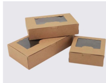
Gambar 4. Kemasan dalam bentuk kardus