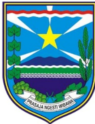
Gambar 3 Lambang Kabupaten Probolinggo

hijau untuk figur buah anggur dan buah mangga serta daun mangga dan daun anggur pada Logo Kabupaten Probolinggo. Meskipun memiliki jenis yang berbeda, kedua buah dan daun tersebut diberi warna yang sama. Ini menyimbolkan kebijakan kesamaan hak etnis yang berada di Kabupaten Probolinggo. Penyamaan warna hijau pada kedua entitas yang berbeda seakan mengosntruksi makna bahwa meski memiliki keberagaman etnis dan suku, tradisi dan budaya, pemerintah Kabupaten Probolinggo tetap menempatkan etnis dan suku yang berbeda tersebut pada hak yang sama, tidak ada pembedaan. Itu tampak sebagaimana pada gambar berikut;