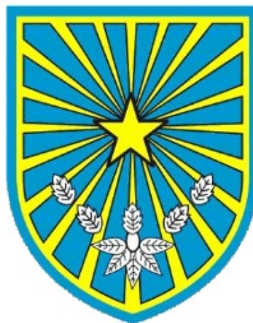
Gambar 2 Logo atau Lambang Kota Probolinggo

Sebagai sebuah wilayah yang memiliki warga masyarakat multikultur, Kota Probolinggo memperlihatkan kesadaran untuk menempatkan berbagai etnis pada tataran yang sederajat, atau memiliki hak yang sama. Hal tersebut tampak pada lambing atau logo Kota Probolinggo. Penempatan Daun Anggur dan Daun Mangga dengan pemilihan pewarnaan putih seakan memberikan pemaknaan bahwa tidak ada perbedaan di Kota Probolinggo. Setiap “daun” memiliki kesamaan nilai, tidak ada yang menjadi dominan dan mendominasi. Hal tersebut memperlihatkan adanya kesadaran bahwa Kota Probolinggo adalah sebuah kota yang multietnis dengan kebudayaannya yang hibrida. Itu tampak sebagaimana pada lambing Kota Probolinggo berikut: