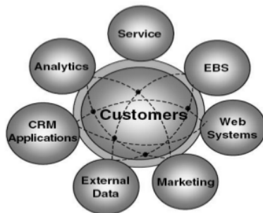
Gambar 1. CRM Management Sphere

Dalam memahami misi dari CRM, hal ini mungkin berguna untuk sketsa sebuah peta fungsi yang berhubungan dengan CRM ditemukan dalam organisasi yang khas. Seperti yang akan dibahas, CRM tidak peduli dengan aspek tertentu dari manajemen pelanggan, namun sebenarnya merangkul beberapa proses bisnis terkait dan mengarahkan untuk mencari cara dalam mengoptimalkan pengalaman pelanggan. Sebagaimana tercantum pada gambar 1, pelanggan adalah titik tumpu dari semua proses CRM