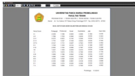
Gambar 6. Laporan penilaian kinerja dosen