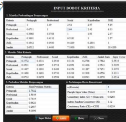
Gambar 2. Input Bobot Kriteria

Sebuah aplikasi penilaian kinerja dosen telah berhasil dikembangkan dengan menerapkan algoritma AHP. Hasil pengujian aplikasi menunjukkan aplikasi yang dikembangkan dapat bekerja sesuai dengan yang diharapkan. Semua fitur yang disediakan berjalan dengan baik dan proses perhitungan dan penentuan penilaian kinerja dosen bekerja sesuai dengan algoritma AHP. Aplikasi ini menghasilkan keluaran berupa dokumen laporan prioritas kinerja dosen yang merupakan hasil dari penerapan metode AHP.